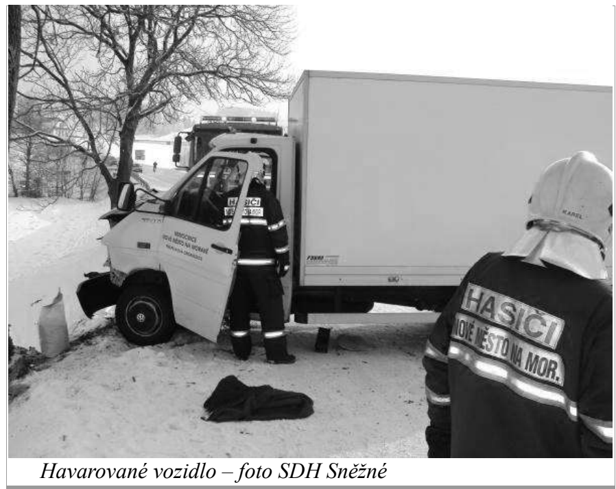
Havarované vozidlo

Po pravděpodobně zmatečném telefonátu jedné z projíždějících řidiček totiž operátorka na tísňové lince vyhodnotila informace o místě a účastnících nehody nesprávně a k mimořádné události vyslala jednotku SDH Nové Město na Moravě, konkrétně k nehodě sanity za Novým Městem na Moravě ve