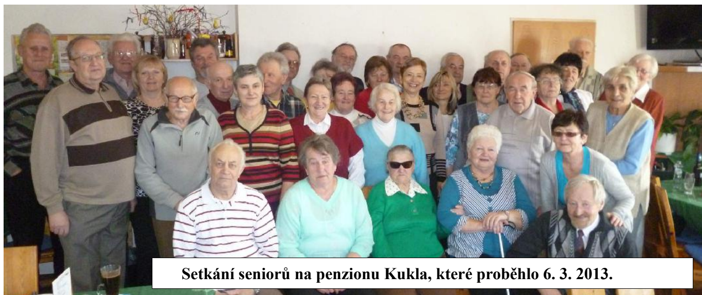
Setkání seniorů na penzionu Kukla, které proběhlo 6. 3. 2013.